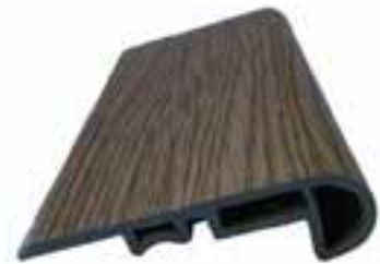
NARIZ DE ESCALERA DISPONIBLE EN

CAPPUCCINO PREMIUM OAK FOREST SILVER OAK MAHOGANY