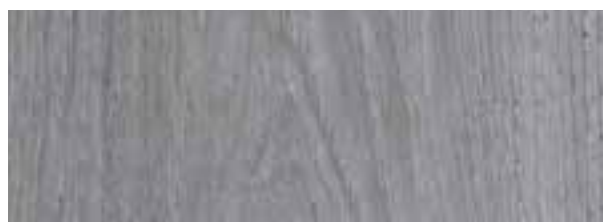
RICHMOND CLÁSICO SPC GRIS MEDIO ECO / 6297001439067