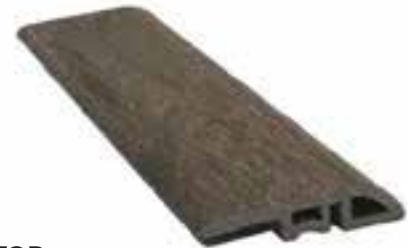
REDUCTOR DISPONIBLE EN

CAPPUCCINO PREMIUM OAK FOREST SILVER OAK MAHOGANY