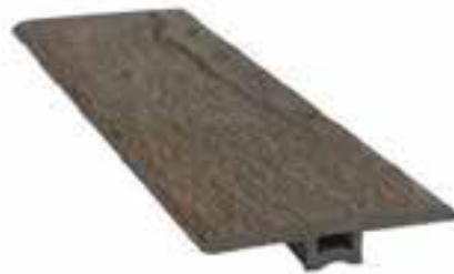
PERFIL ENT DISPONIBLE EN

CAPPUCCINO PREMIUM OAK FOREST SILVER OAK MAHOGANY