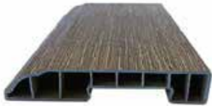
RODAPIÉ SPC DISPONIBLE EN

Tenemos accesorios de suelo SPC para todas tus necesidades de acabado de suelos. Todos nuestros accesorios SPC son completamente impermeables, a prueba de termitas y recubiertos de PVC para una durabilidad sobresaliente.