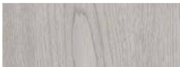
RICHMOND CLÁSICO SPC PLATA ECO / 6297001439036