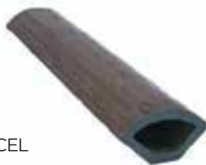
CUARTO BOCEL DISPONIBLE EN

CAPPUCCINO PREMIUM OAK FOREST SILVER OAK MAHOGANY